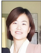
유니스 전 관장

회원여러분 그간 잘 지내고 계신지요? 봉사회는 신관으로 이사를 잘 마치고 기존에 해왔던 모든 사회복지 및 각종 상담 서비스를 월요일에서 금요일, 오전 9시-오후 5시까지 제공하고 있습니다. 구관보다 다소 협소하긴 하지만 회원분들께서 조금이나마 더 깨끗하고 밝은 장소에서 편안하게 서비스를 이용하실 수 있도록 열심히 준비해 놓았습니다.