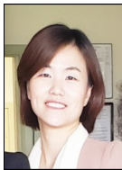
유니스 전 관장

최근 산타클라라 카운티 시니어 영양프로그램 부서에서 25년간 일을 한 매니저 분이 베스컴 센터에 오셔서 참여자의 공헌(Contribution)에 대한 교육을 실시해 주셨습니다. 이날 교육의 요지는 봉사회를 포함하여 산타클라라 카운티 내 40개의 시니어 영양 프로그램(SNP) 제공기관에서 영양적으로 균형잡힌 식사 프로그램을 제공하고 있는데, 이 프로그램이 지금처럼 진행된다면 앞으로 얼마나 오랫동안 유지될지 잘 모르겠다고 예산상 어려움을 토로하시며 다음과 같이 알려주셨습니다.