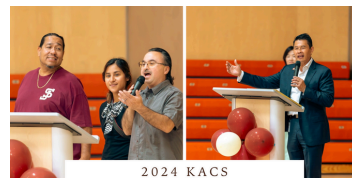
2024 KACS FULL MOON FESTIVAL