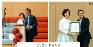
2024 KACS FULL MOON FESTIVAL

한미봉사회는 9월 13일 산호세 베스컴 커뮤니티센터에서 350여 명의 시니어와 그 가족, 지역 주민들이 참석한 가운데 추석 행사를 성대히 개최했습니다. 산호세 시와의 협력으로 진행된 이번 행사에는 지역 정치인들의 축사와 한미봉사회의 지역사회 기여가 강조되었으며, 특히 나상덕 부총영사가 참석하여 봉사회의 노력을 격려했습니다. 시니어 팀의 장구, 라인댄스, 우쿨렐레 공연은 참석자들로부터 큰 박수를 받았고, 경품 추첨과 함께 한국 전통 음식을 제공하여 큰 인기를 끌었습니다. 또한 봉사회는 9개의 저소득 시니어 아파트를 방문하여 200여 명에게 한식 도시락을 전달하며 추석의 따뜻한 마음을 나누었습니다. 이번 행사는 재외동포청과 메가마트의 후원으로 진행되었으며, 한국 문화를 지역사회에 알리는 중요한 기회가 되었습니다. 봉사회는 앞으로도 다양한 프로그램을 통해 한국인 뿐만 아니라 다른 커뮤니티와의 문화 교류를 촉진할 예정입니다.